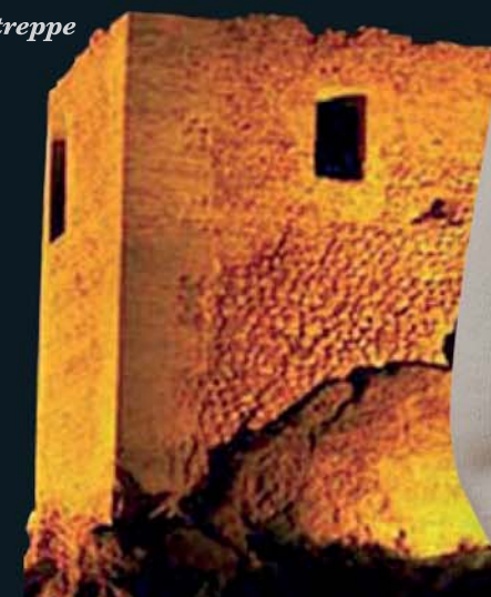
Castillo de Los Vélez

Jeder Winkel von Mazarrón kann Ihnen eine Geschichte erzählen. Die beste Möglichkeit, die Vergangenheit des Ortes kennen zu lernen, ist eine Besichtigung der Fundstätten, Gebäude, Burgen, Kirchen und Museen. Von der Siedlung aus der Kupferzeit in Cabezo del Plomo bis hin zur Punta de los Gavilanes, wo sich noch die Reste der phönizischen Niederlassung aus dem 7.-6. Jahrhundert v. Chr. befinden.