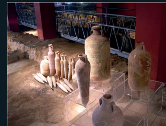
Ánforas (Centro Interpretación "Barco Fenicio")