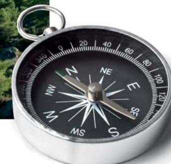
Sierras del interior

Für die Liebhaber von langen Wanderungen gibt es 17 hervorragend ausgeschilderte Routen und Wege, auf denen man den Charme der Gemeinde zu Fuß, zu Pferd, mit dem Fahrrad oder dem Auto entdecken kann.