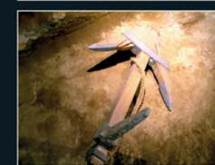
Museo Factoría Romana de Salazones