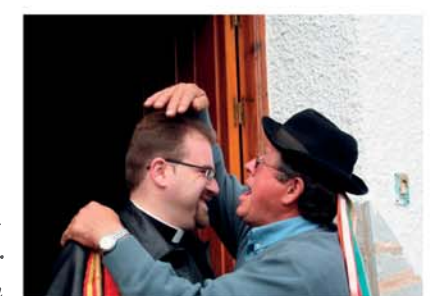
"Primer rebuzno" para el sacerdote de la Ermita de Las Balsicas. (Mazarrón)

Freizeit und Vergnügen genießt man in Mazarrón in Gestalt der vielen Volksfeste, auf denen sich die Traditionen von früher und die Lebensfreude der Menschen verbinden. Zu den bedeutendsten Feierlichkeiten gehört das "Fiesta de Milagro" (Fest des Wunders), das am 17. November gefeiert wird, und in dessen Rahmen die Einwohner eine Prozession der Jungfrau Purísima von Mazarrón bis Bolnuevo veranstalten. Die Legende berichtet, dass die Jungfrau Purísima den Berbern erschien, die den Ort überfallen wollten, und sie so die Einwohner vor dem Übergriff rettete.