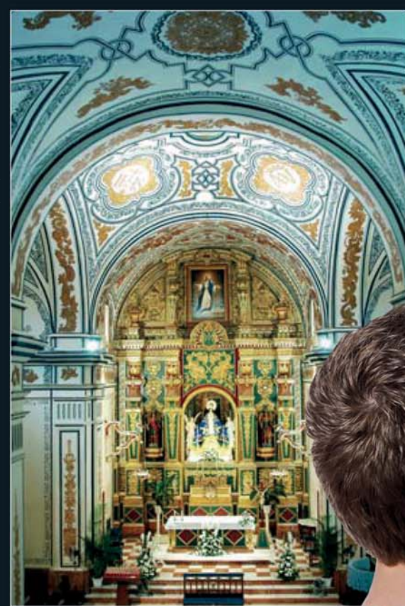
Iglesia de La Purísima

Die Besichtigung der Altstadt des Ortes endet vor dem Rathaus, das den wirtschaftlichen Aufschwung durch die Wiederaufnahme des Bergbaus widerspiegelt, und vor dem Casino, einem wunderschönen Gebäude im Eklektikerstil, in dessen Inneren besonders die Wendeltreppe aus Gusseisen beachtenswert ist.