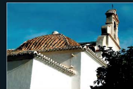
Iglesia-Convento de La Purísima

La visite du centre historique se termine par l'Hôtel de Ville, qui reflète l'essor économique de la ville au moment de la reprise de l'exploitation minière, et le Casino, bel édifice de style éclectique dans lequel on peut admirer un escalier en colimaçon en fer forgé bien particulier.