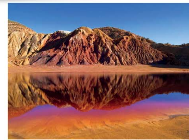
El Charco de la Aguja

Die Winderosionen von Bolnuevo sind eine der attraktivsten Landschaften Mazarróns. Es ist eine besondere, fast magische Landschaft, in der die Erosion des Windes und des Wassers die Felsen launisch geformt hat. Ein ruhiger Ort, neben dem Meer, wo man der Fantasie freien Lauf lassen kann.