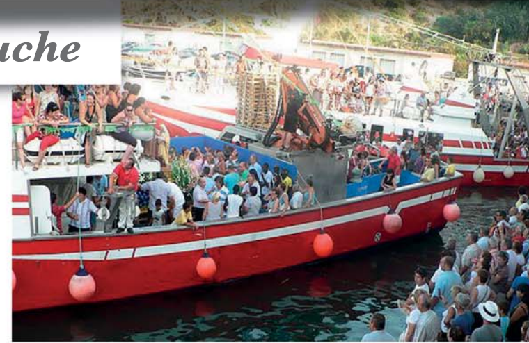
Romería de la Virgen del Carmen, patrona de los pescadores.

Les loisirs et le divertissement animent Mazarrón grâce à ses nombreuses fêtes populaires qui conjuguent la tradition ancienne avec la joie de vivre de ses habitants. L'une des plus importantes est la Fête du Miracle, célébrée le 17 novembre, pendant laquelle les habitants portent en procession la Vierge de la Purísima (Très Pure) depuis Mazarrón jusqu'à Bolnuevo. D'après la légende, la Vierge de la Purísima apparut aux barbares quand ceux-ci s'apprêtaient à envahir le village et sauva ainsi ses habitants de l'incursion.